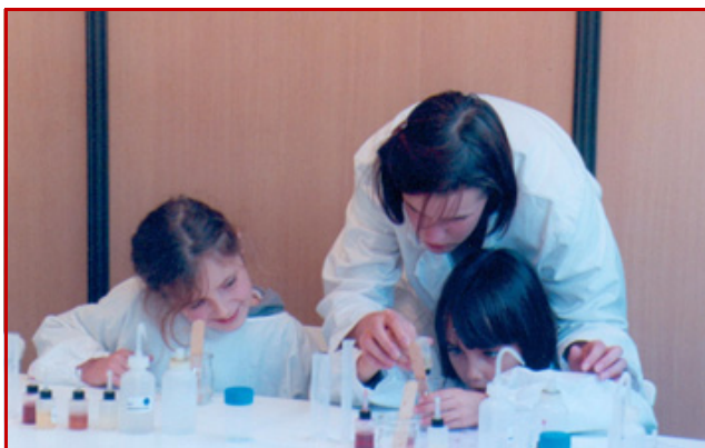
Figure 7 - Expérimentation soignée dans un atelier Graine de Chimiste.

Nous hiérarchisons ces objectifs selon l'âge des participants, leur niveau, le contexte de nos activités. Avec des