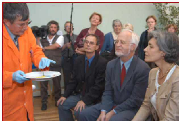
Figure 6 - Pierre Aldebert et Claudie Haigneré à la Fête de la Science allemande (Mayence, septembre 2003).

PA : Au contraire ! Et en l'occurrence, pour clore ce témoignage sur mes activités, j'aimerais saluer les décisions des Sciences chimiques du CNRS et de ma Commission d'évaluation de chercheurs qui me permettent, depuis 2002, de faire à plein temps ce travail de médiation-vulgarisation. Aujourd'hui trop sollicité, je ne peux répondre à toutes les demandes et pour pallier ces déficiences, je participe, depuis 2002, à la formation des professeurs des écoles à la vulgarisation scientifique ainsi que des moniteurs du Centre d'Initiation à l'Enseignement Supérieur (CIES) de Grenoble. Cette thématique « éveil aux sciences à l'école » que j'ai initiée attire, année après année, ces jeunes scientifiques en nombre toujours plus élevé. Cette relève de qualité qui se profile et qui commence à être nombreuse (plus de 20 doctorants pour l'année 2004-2005) est un grand espoir pour tenter d'enrayer cette désaffection des sciences dont on parle tant et dont on n'a pas encore constaté sur le terrain les catastrophes qu'elle ne va pas manquer d'induire, toutes sciences exactes confondues.