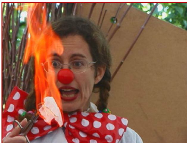
Figure 4 - Le Clown Molécule s'est fait piéger par le professeur Spatule. Spectacle de chimie amusante des Atomes Crochus.