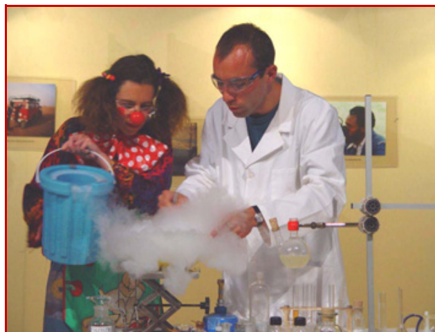
Figure 5 - Spectacle de gastronomochimie de Spatule, Capsule et Molécule (R.-E. Eastes, F. Pellaud et C. Bied) : fabrication d'une glace à l'azote liquide (Montpellier, 2003).

CB : Dans le spectacle de chimie amusante et le spectacle de gastronomochimie proposés par Les Atomes Crochus (figure 5), dès son entrée sur scène, le clown Molécule capte l'attention des enfants qui s'adressent au clown directement et sans retenue, en lui posant des questions ou inversement en répondant aux questions que le clown leur pose, ce qu'ils n'oseraient souvent pas faire lors d'une présentation « classique » par un savant en blouse blanche. Ainsi, grâce à la présence du clown, l'enfant affectivement attiré est mis en